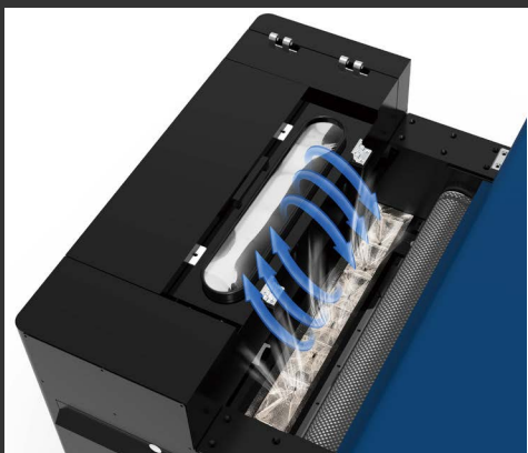
Recupero colla ad aria