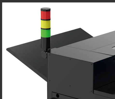
Spia luminosa a tre colori