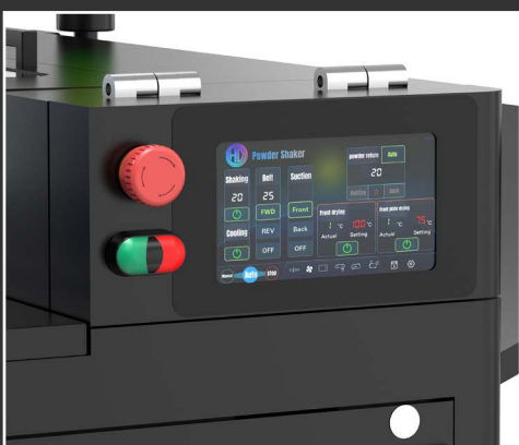
Display touch screen