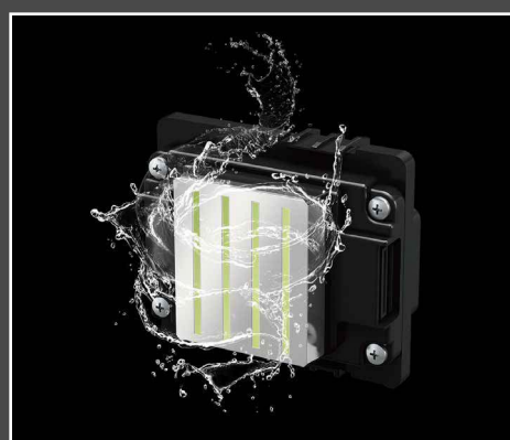
Pulizia automatica della testina di stampa