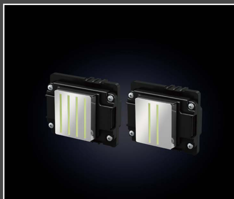
EPSON i3200-A1HD + i1600-A1