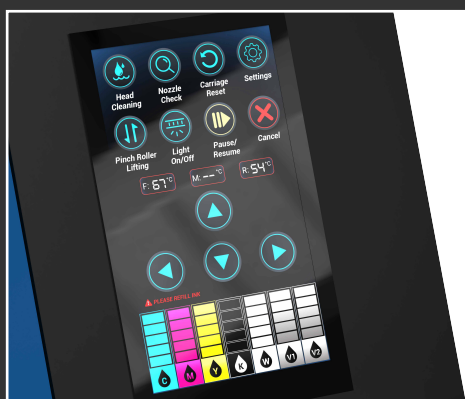
Nuovo pannello di controllo LCD