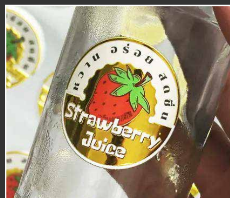
Adesivi UV laminati con oro, argento ed alti colori