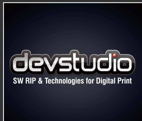
HD RIP (devstudio) software