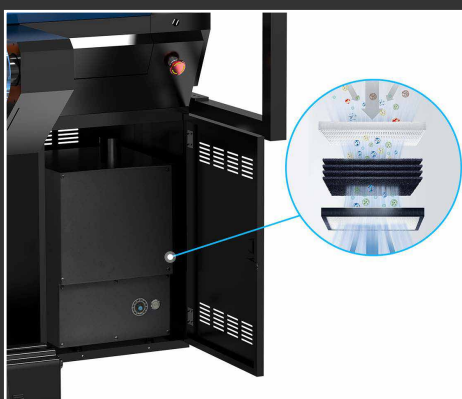
Purificatore degli odori integrato