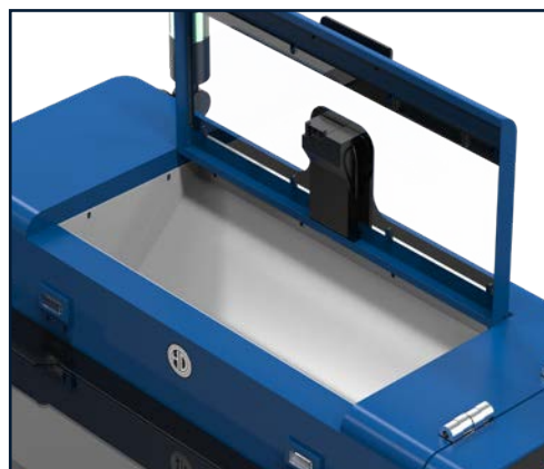
Sistema di allarme mancanza di polvere