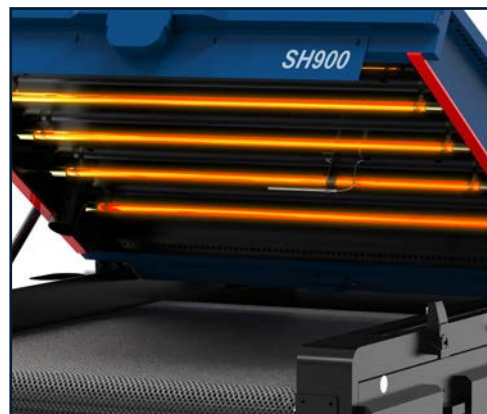
Sistema di lampade migliorato a risparmio energetico