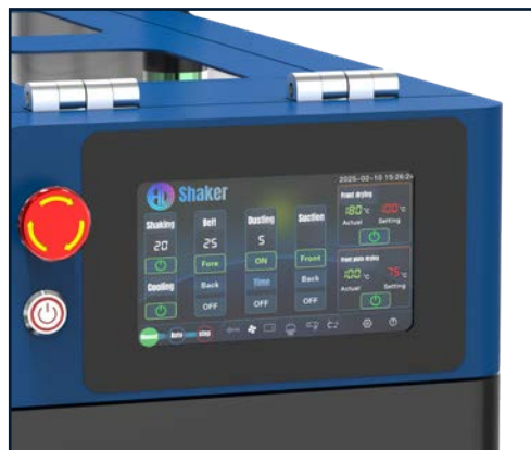
Pannello di controllo touch screen

PANNELLO DI CONTROLLO DELLO SHAKER A COLORI / DUE VASSOI PER IL RECUPERO DELLA COLLA SENSORE DI PROTEZIONE SUL COPERCHIO DELLO SHAKER / SISTEMA DI RISPARMIO ENERGETICO PER GESTIRE LE PAUSE DEL LAVORO SPIA LUMINOSA A TRE COLORI / DOPPIA ASPIRAZIONE SUL TAPPETO SENSORE DI CONTROLLO PELLICOLA A DUE LENTI / FUNZIONE DI ALLARME PER MANCANZA DI COLLA