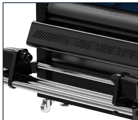
Doppio motore su avvolgitore