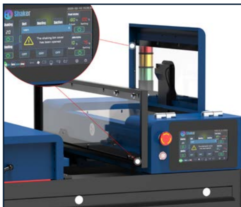
Funzione di protezione sull'apertura del coperchio