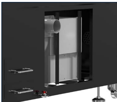
Filtraggio del fumo integrato