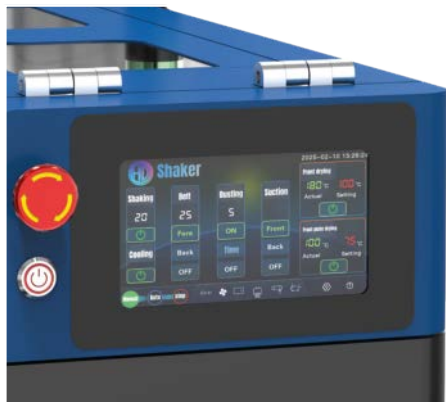
Pannello di controllo touch screen