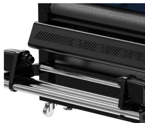
Doppio motore su avvolgitore