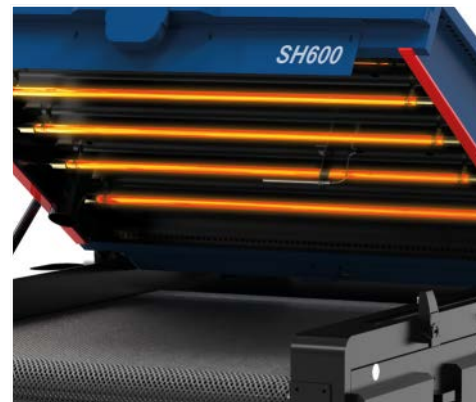
Sistema di lampade migliorato a risparmio energetico