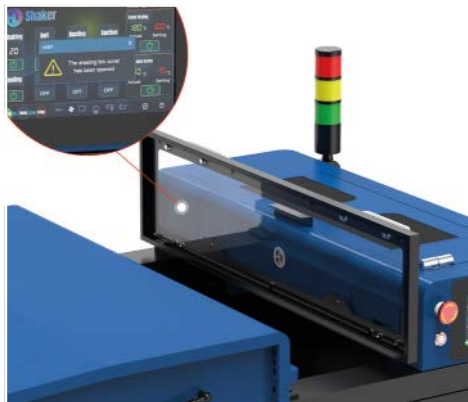
Funzione di protezione sull'apertura del coperchio