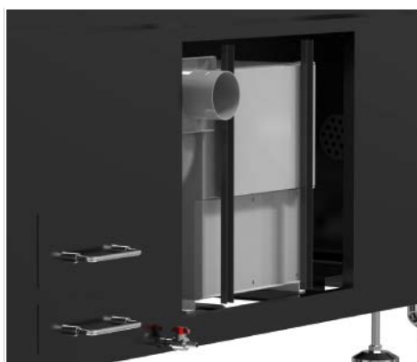
Filtraggio del fumo integrato